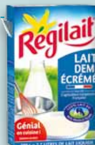
Lait en poudre RÉGILAIT SODIAAL

La célèbre marque coopérative de lait en poudre et lait concentré ne cesse de se renouveler pour proposer de nouveaux produits et modes de consommation autour des laits d'épicerie.