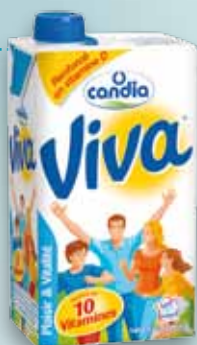
Lait VIVA SODIAAL

Marque emblématique de la coopérative Sodiaal, Candia est la référence française en lait de consommation et accompagne les foyers français depuis 45 ans.